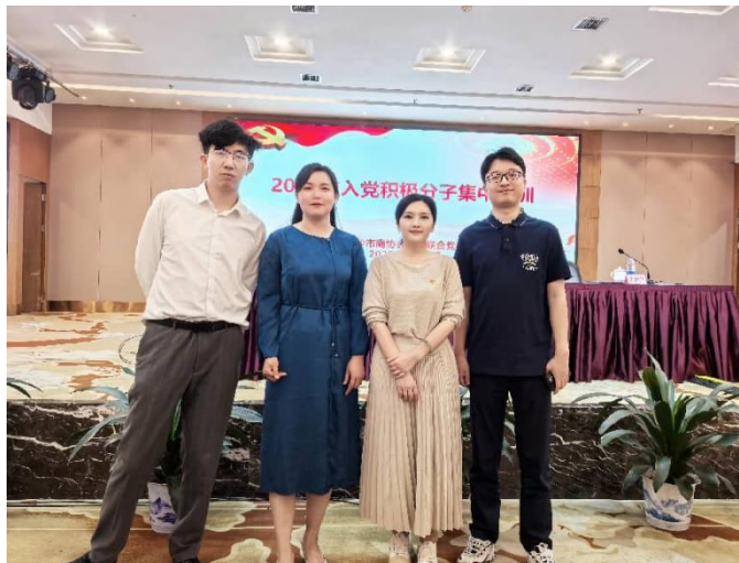
5月15日,商会党支部组织参加长沙市商协会组织联合党委2025年入党积极分子培训。