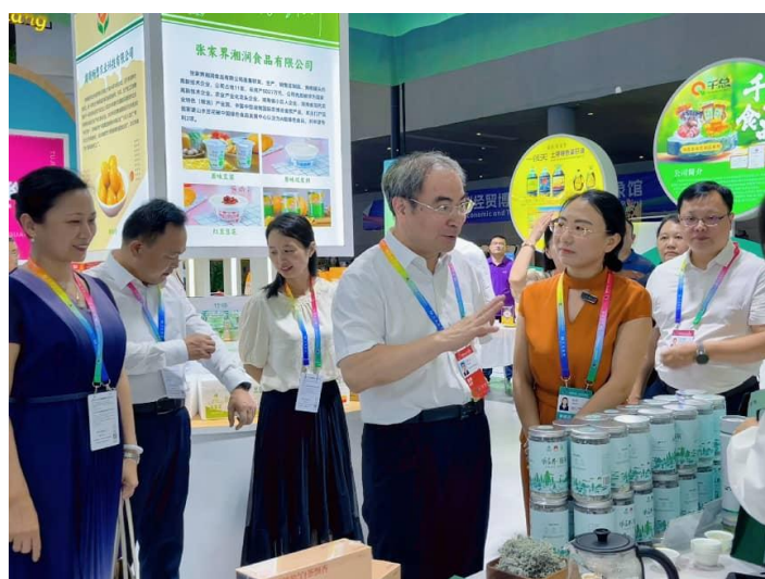
6月12日，“张家界之窗”运营团队积极参展第四届中非经贸博览会。