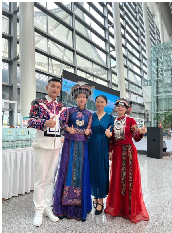
6月18日，“张家界之窗”运营团队积极参展“三湘四水 相约湖南”之“市州风情周周看”张家界站大型文旅推广活动。