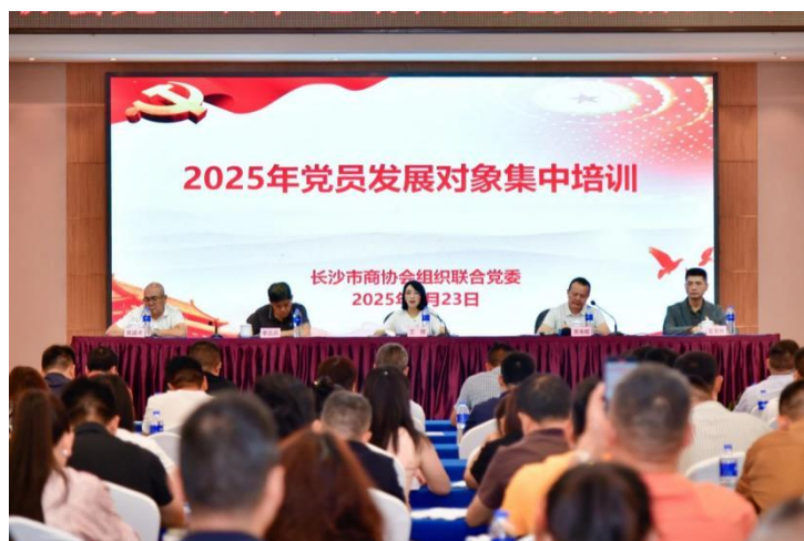
6月23日,商会党支部组织参加长沙市商协会组织联合党委举办的党组织书记培训暨2025年党员发展对象集中培训。