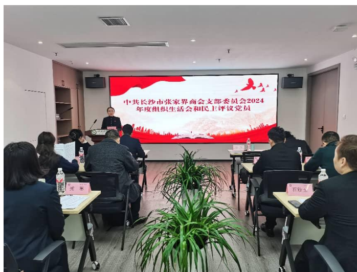
3月14日，中共长沙市张家界商会支部委员会顺利召开2024年度组织生活会和民主评议党员会议。

商会始终坚持党的全面领导，将政治建设摆在首位，通过深化理论学习、严肃组织生活、筑牢宣传阵地，不断强化思想政治引领，确保商会发展方向始终与党和国家事业同频共振。会长班子及常委会发挥核心引领作用，践行责任担当，推动商会治理体系高效协同，为商会持续健康发展奠定了坚实的政治与组织基础。