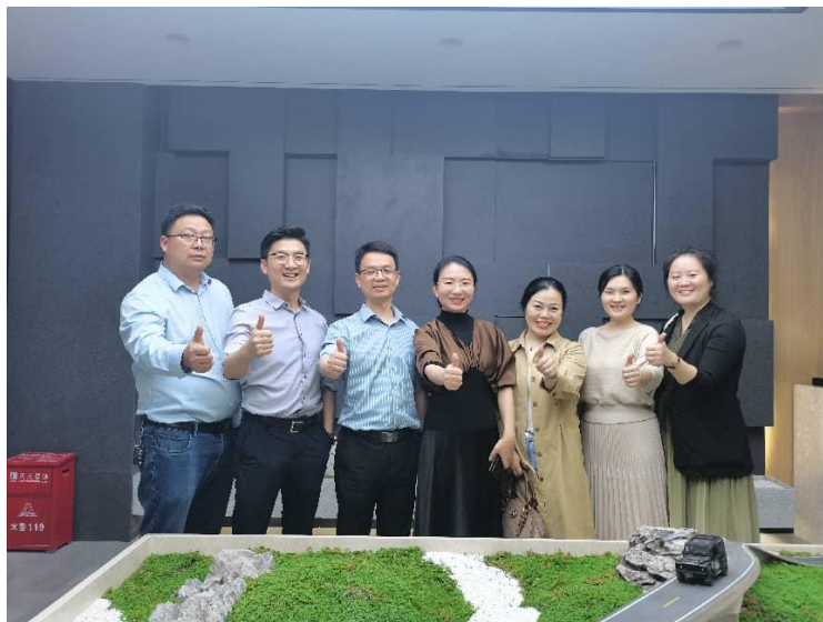
4月27日，走访会员企业迅捷交通科技集团有限公司湖南分公司。