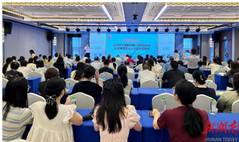
6月26日，商会代表参加“社创星动力”长沙市工商联所属行业协会商会法人治理及