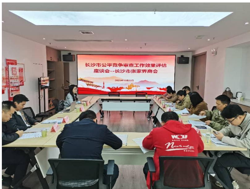
10月22日，商会承办长沙市公平竞争审查工作效果评估会。