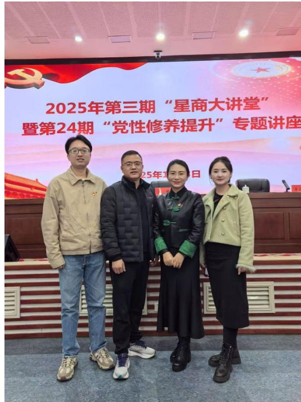
12月3日，商会党支部组织参加2025年第三期“星商大讲堂”暨第24期“党性修养提升”专题讲座。