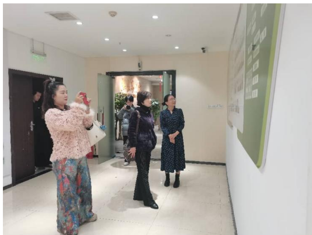
3月31日，湖南省名优特产商贸协会一行莅临商会考察交流。