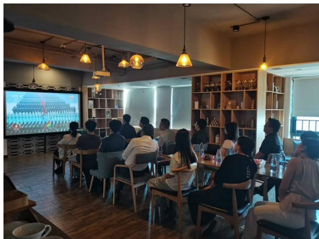
9月3日，商会支部委员会组织全体党员观看纪念中国人民抗日战争暨世界反法西斯战争胜利80周年阅兵式直播。