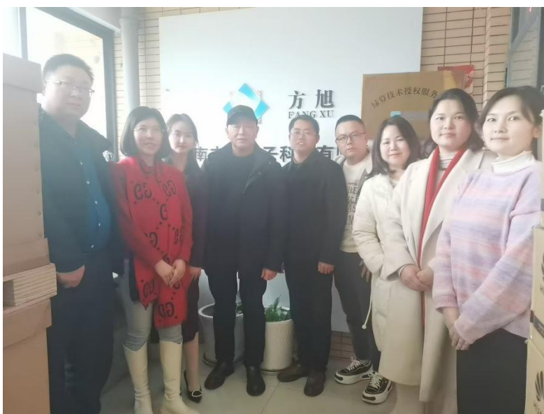
2月24日，走访副会长单位湖南方旭电子科技有限公司。