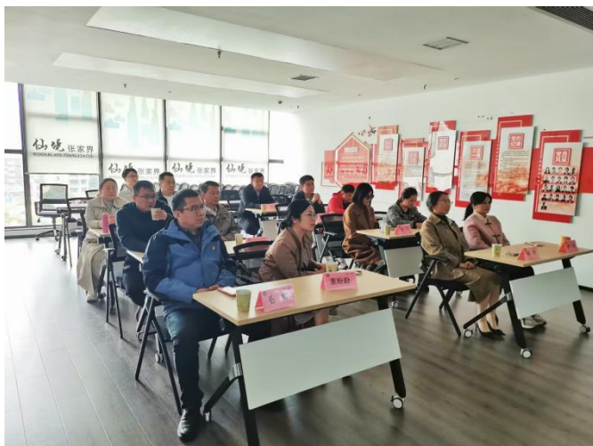
10月22日，商会党支部组织开展“淬炼党性担使命 砥砺前行促发展”主题教育观影活动。