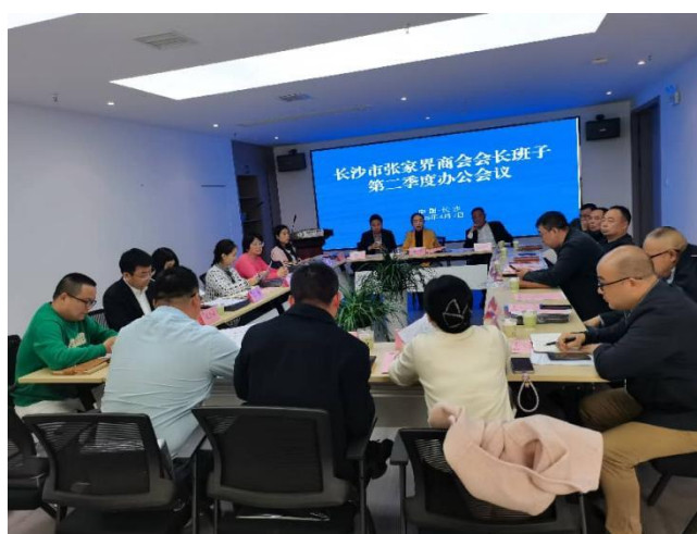
4月7日,商会召开2025年第二季度会长办公会。