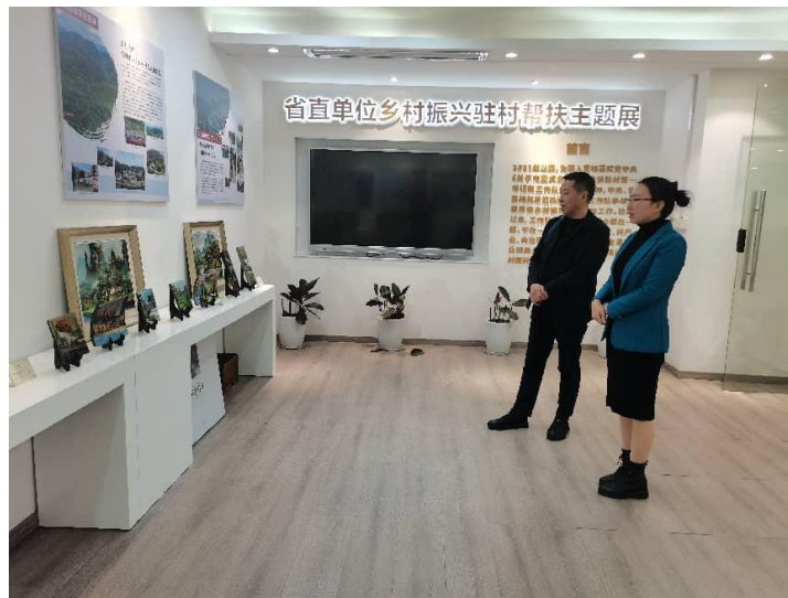
1月3日，长沙市川渝商会秘书长一行莅临商会考察交流。

融合资源、优势互补、共同发展。”不断探索商会发展新路径。今年以来，商会在做好会员内部交流沟通的基础上，加强友好往来，加强资源信息交流，扩大澧商“朋友圈”，通过横纵贯通的新模式，有效拓宽商会发展的维度，为商会会员企业高质量发展注入新动力。