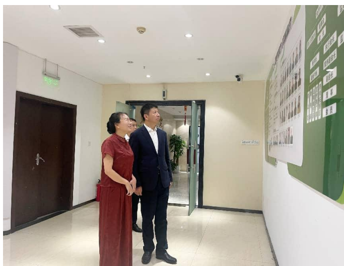
4月22日，中共张家界市委副书记、市长王洪斌莅临商会走访慰问。