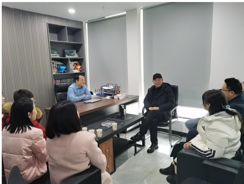
2月25日，走访常务副会长单位国辉工程机械设备租赁有限公司。