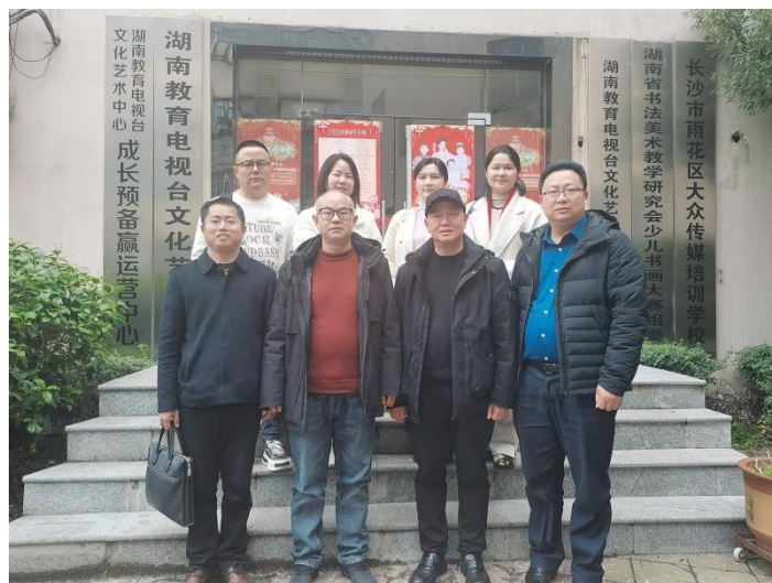
2月24日，走访副会长单位长沙念祖教育科技有限公司。