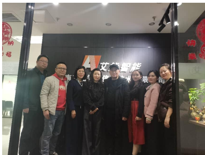
2月26日，走访副会长单位湖南艾能智能信息技术有限公司。