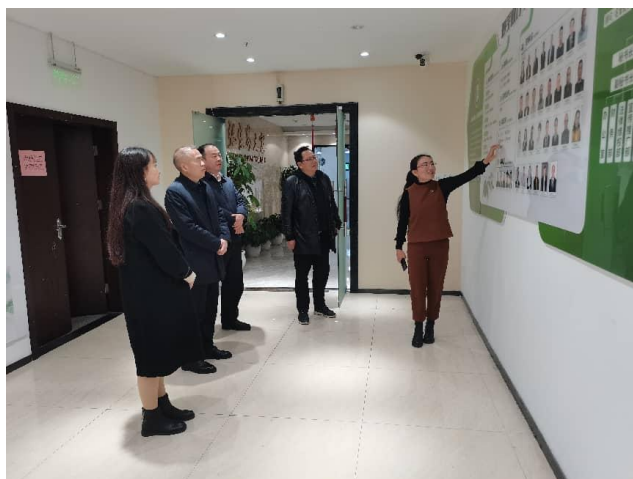
2 月 14 日，张家界市政协党组书记、主席杨广林一行莅临商会调研指导。