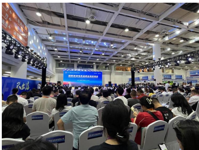
8月29日，“张家界之窗”参展2025湖南（长沙）跨境电商交易会。