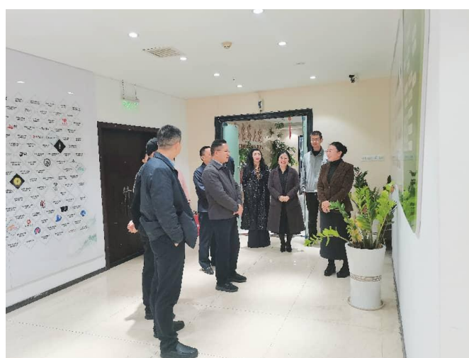
张家界市委常委、统战部部长赵云海率调研组莅临商会考察调研。