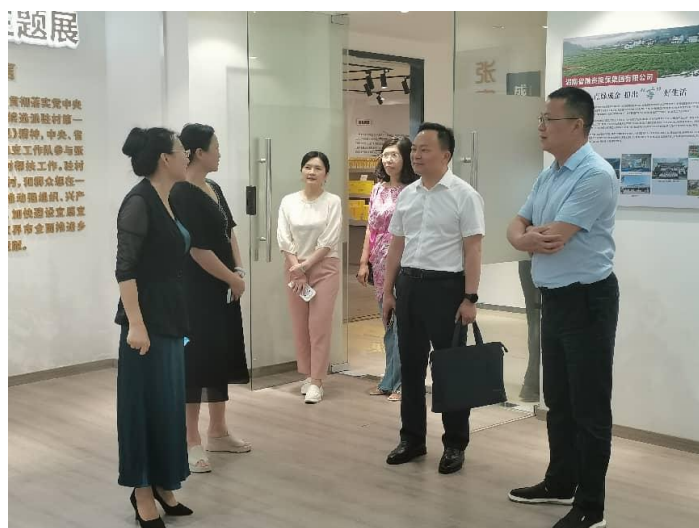
5月21日，张家界市人民政府副市长莫海宏率队莅临商会调研指导。