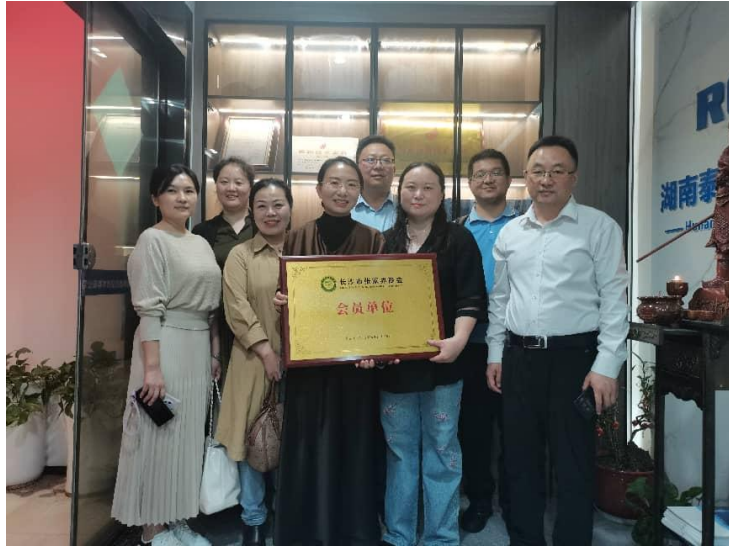
4月27日，走访会员单位湖南泰德航空技术有限公司。