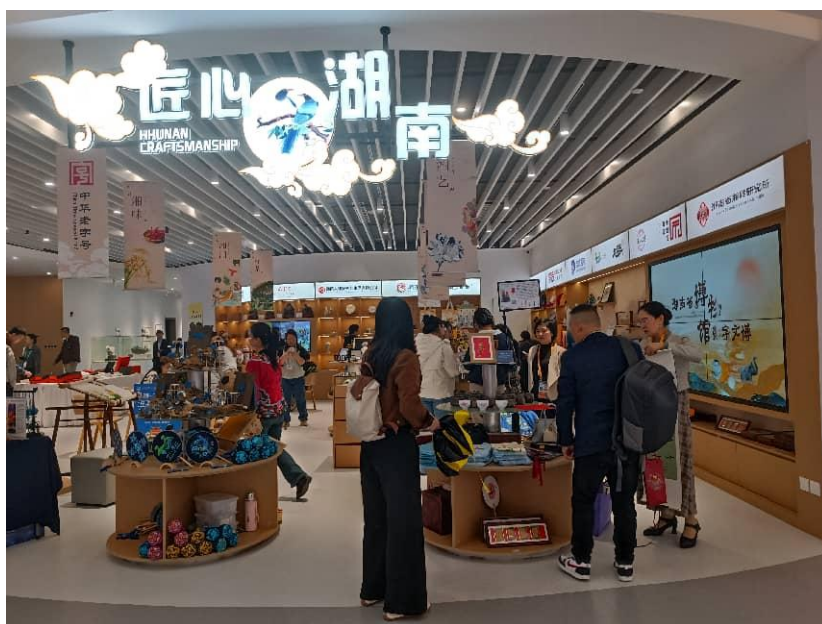
11月5日，“张家界之窗”运营中心总监率队前往观展第八届中国国际进口博览会。