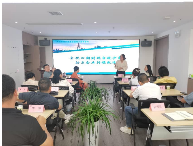
5月26日，商会与会员单位长沙双盈财务有限公司联合举办“金税四期财税合规沙龙”。