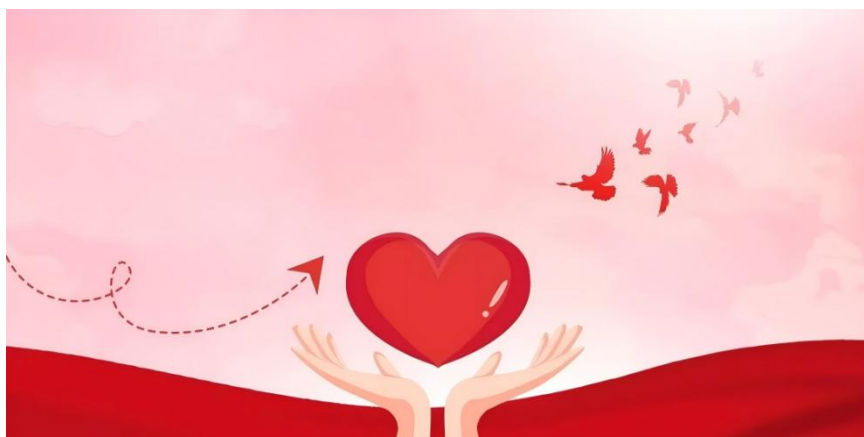
6月18日，商会组织会员企业为遭遇特大洪涝灾害的家乡捐款。