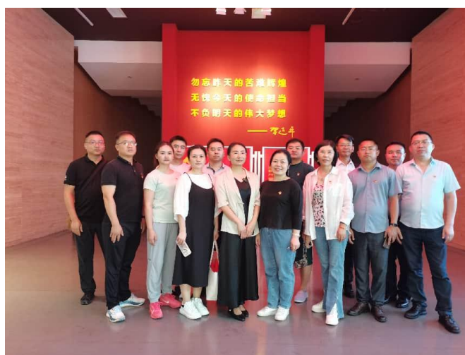
7月1日,商会党支部组织开展“追寻红色足迹 传承奋斗精神”主题党日活