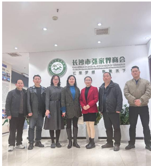
3月13日，永顺驻长办、株洲大湘西商会一行莅临商会考察交流。