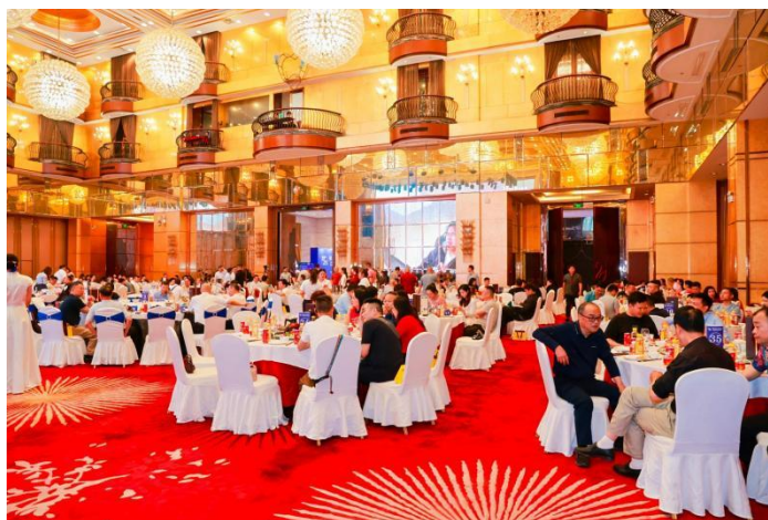
4月20日，商会召开第二届第二次会员大会暨“张品出张 湘飘四方”张家界名优特农副产品推介会。