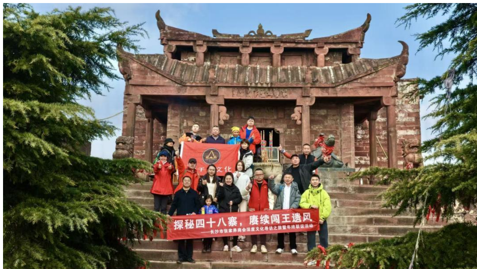
12月12—14日，商会党支部胡以“探秘四十八寨，赓续闯王遗风”为主题，举办了一场融合文化寻访、生态体验与年终联谊的深度之旅。